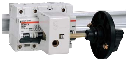
27046 + 27048